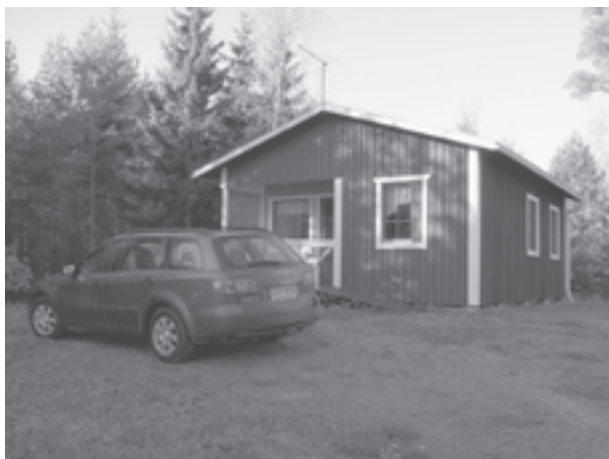
Kuvia TX1-peditionilta, ks. artikkeli seuraavalla sivulla.