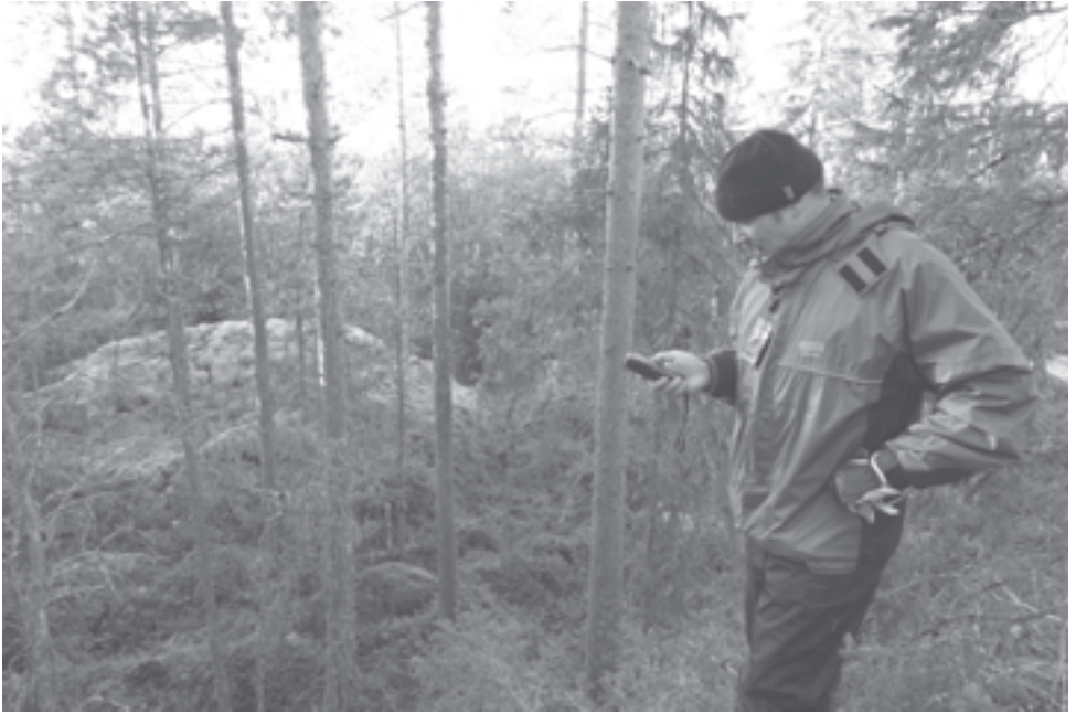
VJR navigoimassa GPS-kapulan kanssa 19.10. lattarilankaa vedettäessä (730 m 273°).

haaksi syödä Keskustorin Mäkkäristä ostamani BicMac-hampurilaisen ajon aikana "lennossa". No, saihan siitäkin energiaa elimistöön. Rupesin sitten perillä kasailemaan FM-antenneja. Mukanani oli 2 kpl 8-elementtisiä Triaxeja, kääntäjä sekä mastotarpeita. Sain toisen antennin verannan kaiteeseen kiinnitettyyn mastoon ja pistin sen toiveikkaasti vertikaaliasentoon. Horisontaali-antennin jätin makamaan verannan kaiteelle. Mutta ne FM-kelit... neidän loistivat poissaolollaan. Vain 5 kilowattinen Uumajan RIX 104,2 suostui heikosti kuulumaan.